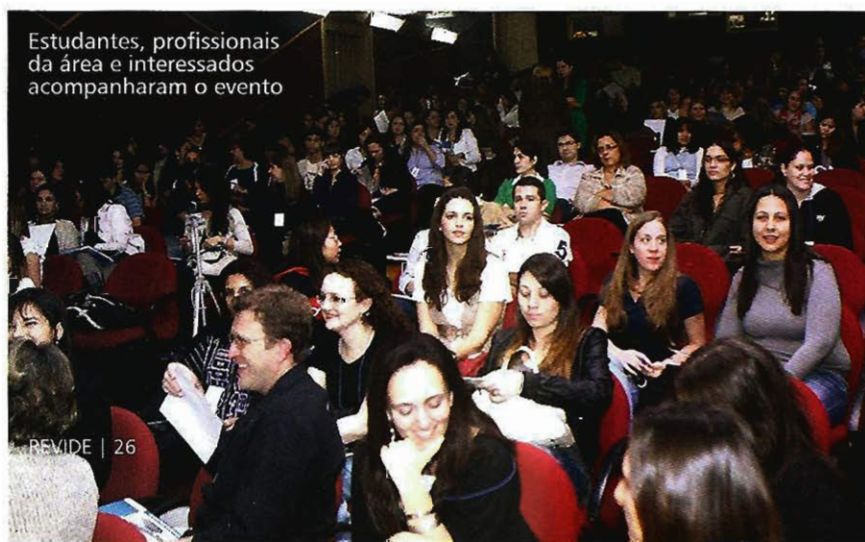
Estudantes, profissionais da área e interessados acompanharam o evento